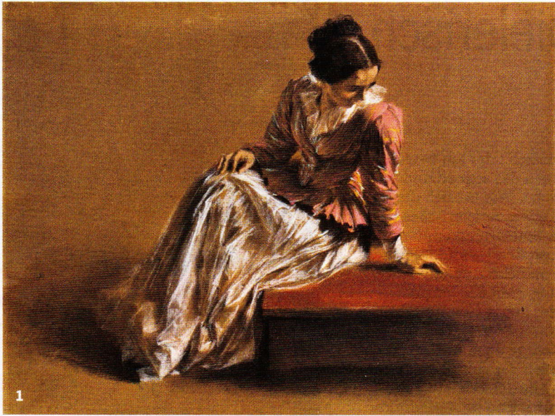
FOTOSTUDIO BARTSCH, KAREN BARTSCH, BERLIN 2016